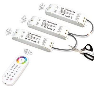
R4-5A Wiring Diagram

Võimaldab ühendada juhtimisse kuni neli kanalit. Igas kanalis 5A. Kas siis RGB + valge või kõik valged. Töösagedus: 2.4GHz Toitevahemik: DC5V kuni DC24V Maksimaalne võimsus: 4x 5A Max 20A 12V puhul 60W kanal ehk siis 4 x 60W Maksimaalne võimsus 100W/240W/480W (5V/12V/24V) Tööraadius: 50m Töötemperatuur: -30°C kuni +55°C paki mõõt: L178×W48×H33mm