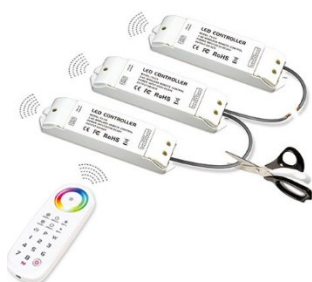
R4-5A Wiring Diagram